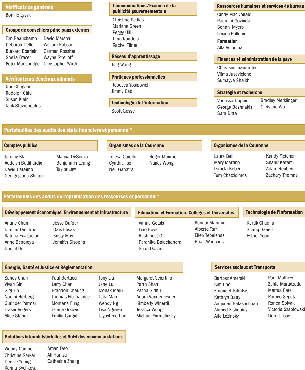
Figure 1 : Organigramme du Bureau, 30 novembre 2018

* Les membres du personnel qui occupent un poste de niveau inférieur à celui de gestionnaire passent d'un portefeuille à l'autre afin de répondre aux pressions saisonnières sur la charge de travail en audit des états financiers.